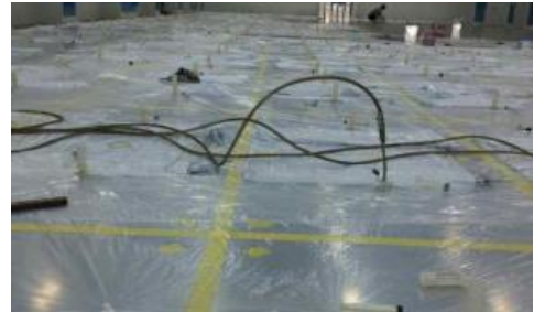
<균열부위 에폭시 주입 시공>