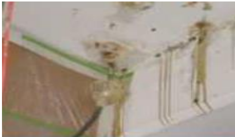
<건축물 크랙 보수>